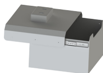
Tiroir de rangement (WLB-1050)