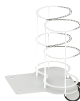
Giá đựng bình Oxy (WLB-1060)